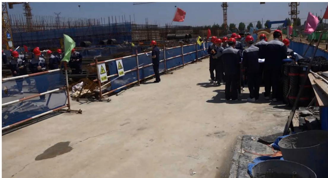
图 3-1 参赛学生积极备赛

为解决职业院校建筑专业学生“纸上谈兵”的实践困境，企业主动开放生产实践场地（图 3-2），搭建起理论与实操结合的实战平台，为学生技能提升提供关键支撑，企业人员还担任学生企业实习指导教师。