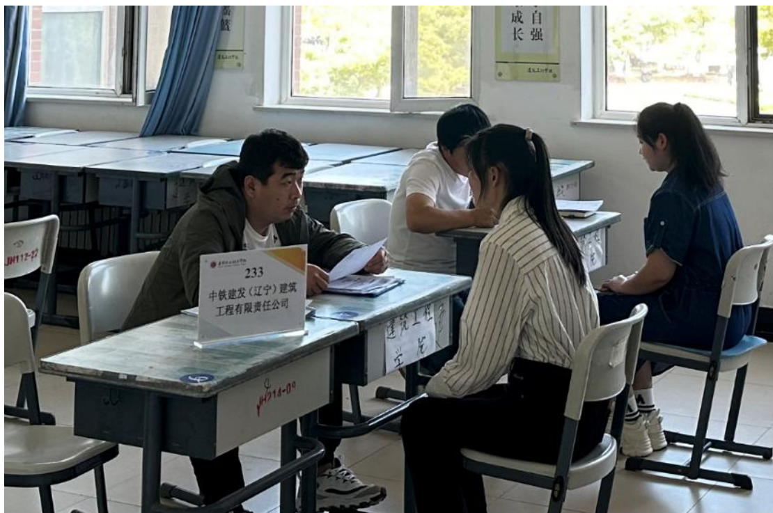
图 5-1 中铁建发（辽宁）建筑工程有限公司校园招聘

中铁建发（辽宁）建设管理有限责任公司与盘锦职业技术学院建筑工程学院合作以来，建筑工程学院连续几年向企业输送了多名实习学生（图 5-1），涵盖建筑技术、工程造价、行政管理等多个岗位，学生凭借扎实的专业技能与良好的职业素养，快速适应企业工作节奏，多数成为岗位骨干力量，获企业高度认可。通过定向输送，企业招聘成本显著降低，人才留存率大幅提升；学校毕业生就业率持续保持高位，就业质量稳步提升，校企合作黏性进一步增强。部分表现突出的同学，已经进入公司的领导层。