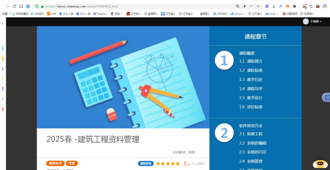
图 4-2 校企合作建设课程

通过校企共建课程，课程质量大幅提升，学生学习积极性增强；毕业生实践能力与职业素养突出，就业率及就业质量持续提高，获用人单位广泛认可；校内教师实践教学能力提升，形成优质“双师型”团队，校企合作关系也更为紧密。校企共建的《建设工程资料管理》课程，参加辽宁省职业院校教学能力大赛，获得二等奖。