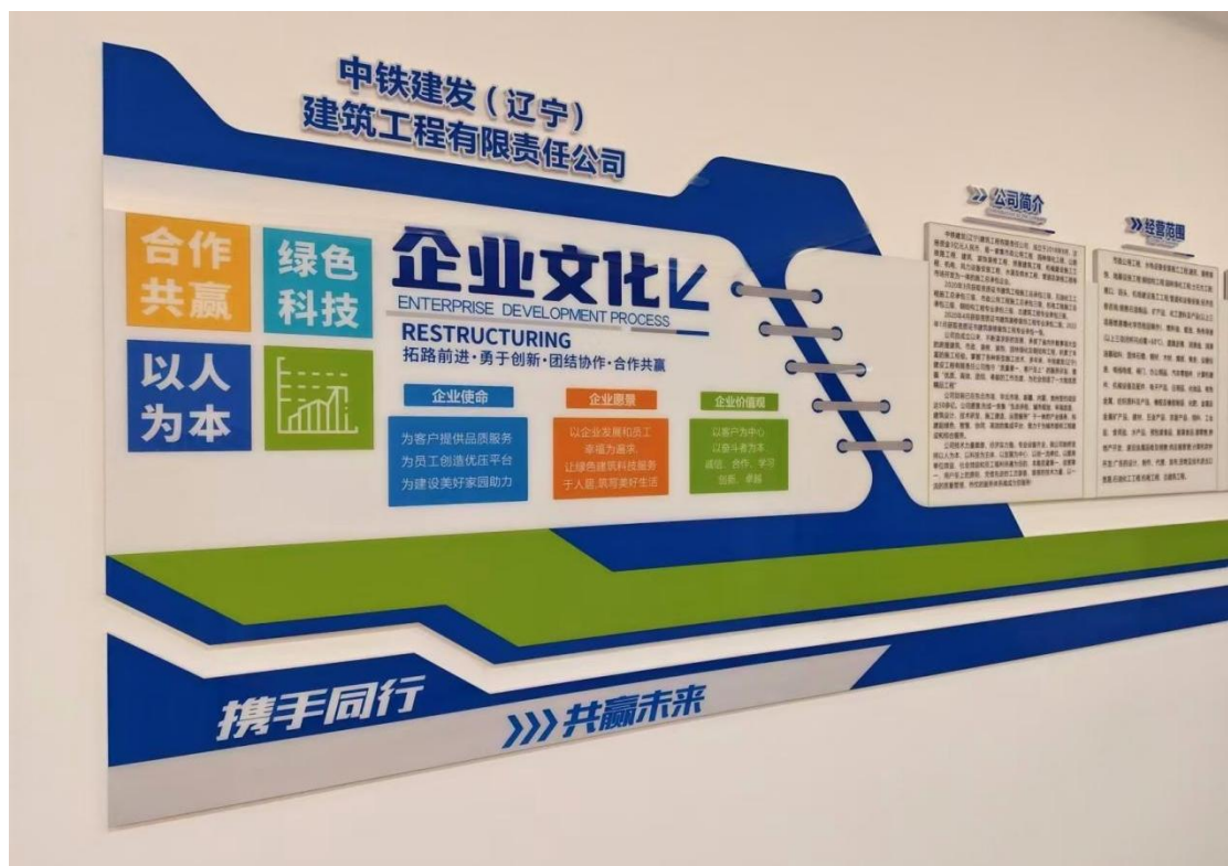
图 1-1 公司文化

中铁建发（辽宁）建筑工程有限责任公司，成立于 2018 年 9 月，注册资金 3 亿元人民币，公司位于辽宁省盘锦辽东湾新区，统一社会信用代码 91211100MA0Y2Y6266。是一家集市政公用工程、园林绿化工程、公路铁路工程、建筑、装饰装修工程、房屋建筑工程、机械建设施工工程、机电、风力设备安装工程、水源及供水工程、管道及架线工程等市场开发为一体的施工总承包企业（图 1-1）。