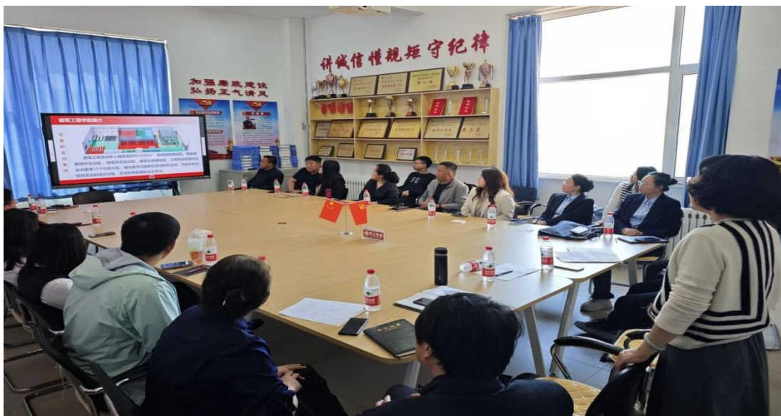
图 4-1 企业参与研讨人才培养方案