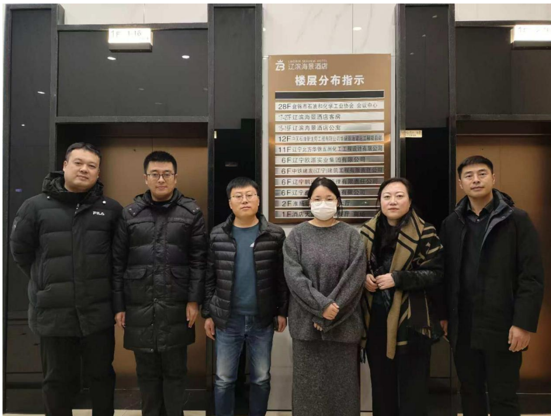
图 4-4 教师参加企业实践

另外，企业的教师也担任实习学生的企业指导教师，企业教师结合自身丰富的工程经验，为学生制定个性化实习计划：从施工现场安全规范讲解，到钢筋绑扎、混凝土浇筑等实操技能示范，手把手纠正学生操作偏差；针对学生在图纸解读、施工流程衔接中遇到的问题，结合项目实际案例细致答疑，帮助学生理解理论知识在实践中的应用逻辑。同时，企业教师注重培养学生的职业素养，引导学生适应企业工作节奏，传授沟通协作、质量管控等职场经验。