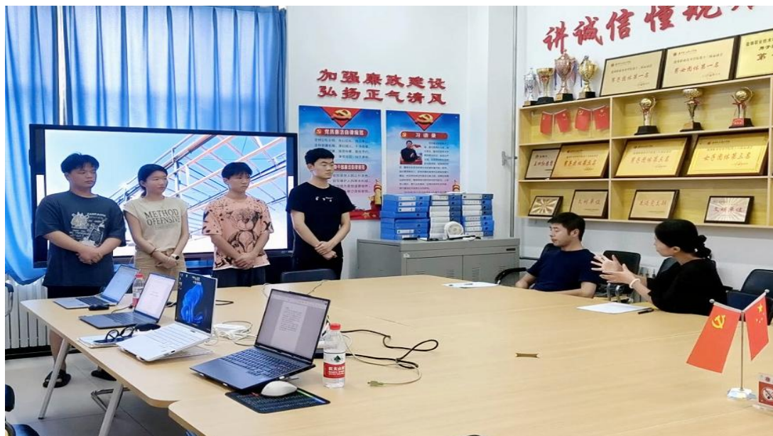
图 3-2 学生到现场体验

为解决职业院校建筑专业学生“纸上谈兵”的实践困境，企业主动开放生产实践场地（图 3-2），搭建起理论与实操结合的实战平台，为学生技能提升提供关键支撑，企业人员还担任学生企业实习指导教师。