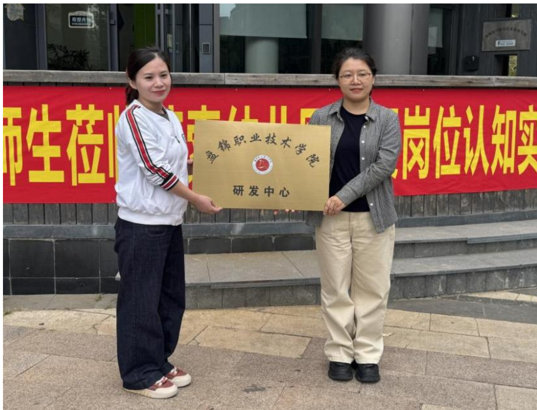
图 5-3 盘锦职业技术学院与菲索幼儿园共同成立校企研发中心