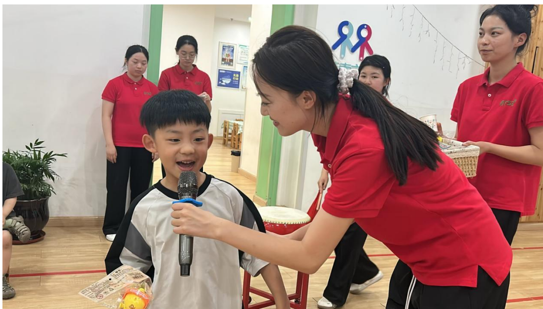
图 5-1 师范教育学院学前教育专业 2023 级实习生在幼儿园工作场景

教育现场，观察并参与幼儿日常活动，在实践中掌握儿童心理发展特点与教育教学方法（图 5-1）。通过直接与幼儿互动，学生们逐步培养了教育工作所需的耐心、爱心和责任感，这些职业素养的形成为其未来职业发展奠定了坚实基础。