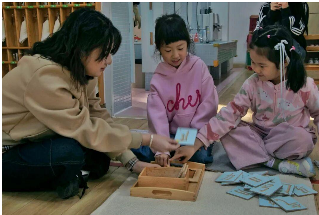
图 5-2 师范学院教师企业实践