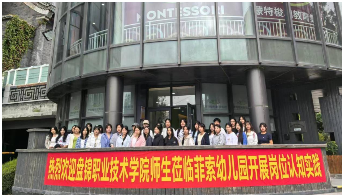
图 3-1 师范教育学院 2025 级学生在菲索幼儿园进行岗位认知实践