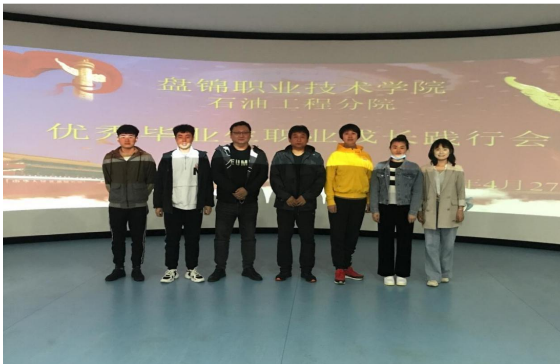
图 1 现代学徒制班优秀学徒表彰

业技术学院石油工程学院 2020 级石油类专业 30 名学生入企，以现代学徒制（双元培育）培养模式进行岗位训练。