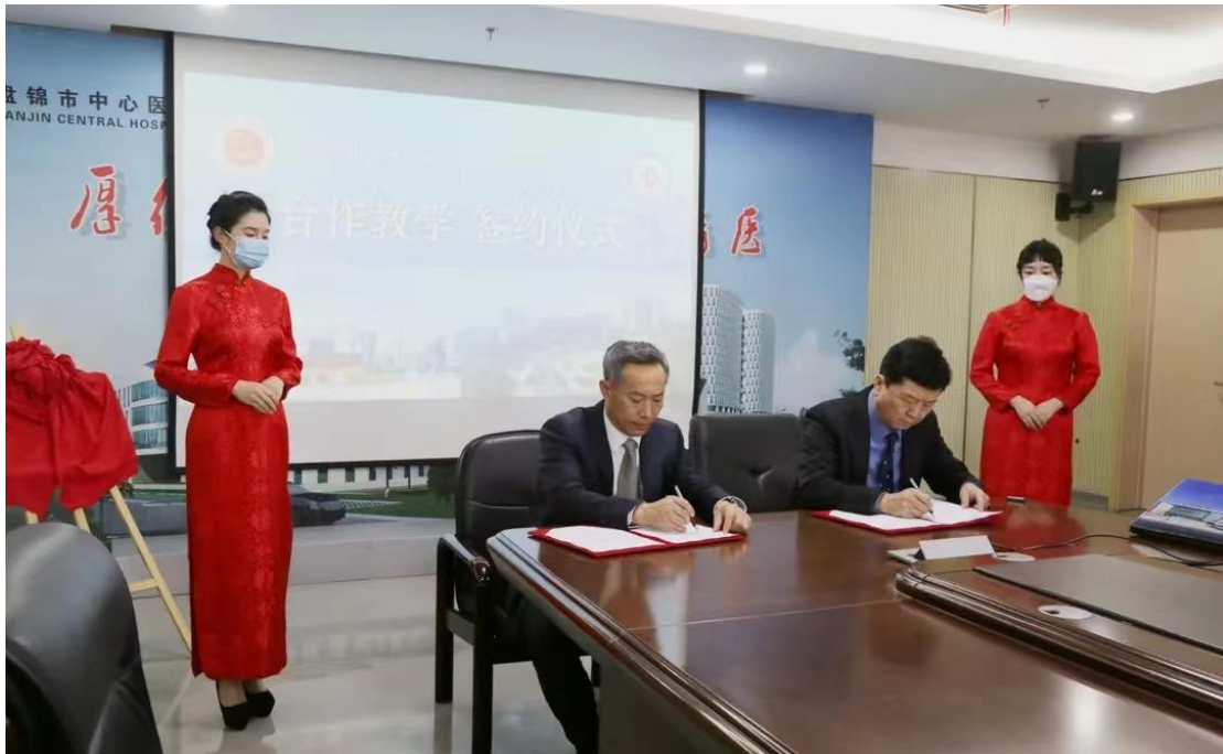
图1 盘锦市中心医院与盘锦职业技术学院签订合作教学协议

2015年5月，盘锦市中心医院与盘锦职业技术学院签署校企合作协议书，以培养优秀的临床护理人才为目标，创新校企合作新模式。合作协议的签署为双方的深度合作和共同发展奠定了基础，院校双方在医教研等方面紧密合作，优势互补，互利互惠，推进双方在临床医教研工作向更高层次发展。2021年11月，与盘锦职业技术学院签订合作教学协议（图1），成为盘锦职业技术学院教学实践基地。