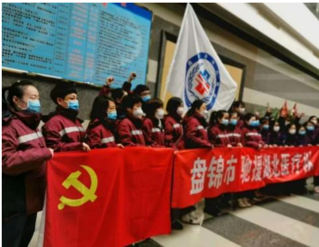
图 5 盘锦职业技术学院优秀毕业生驰援武汉

用实际行动践行南丁格尔精神、恪守职业操守，在 2020 年疫情期间挺身而出驰援武汉（图 5）。