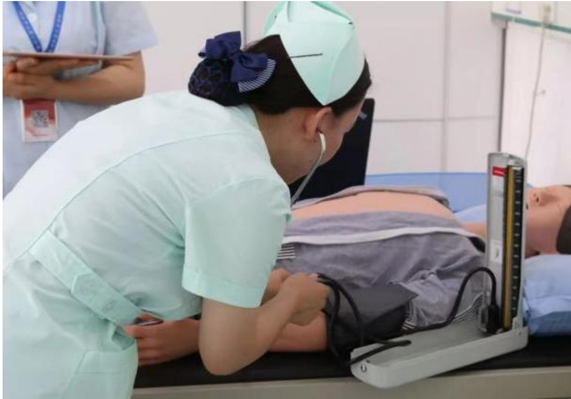
图4 临床教师对学生进行实训项目考核

脉输血、皮内注射、皮下注射、肌内注射、晨晚间护理、导尿、灌肠、鼻饲、静脉血采集动脉血采集等（图4）。