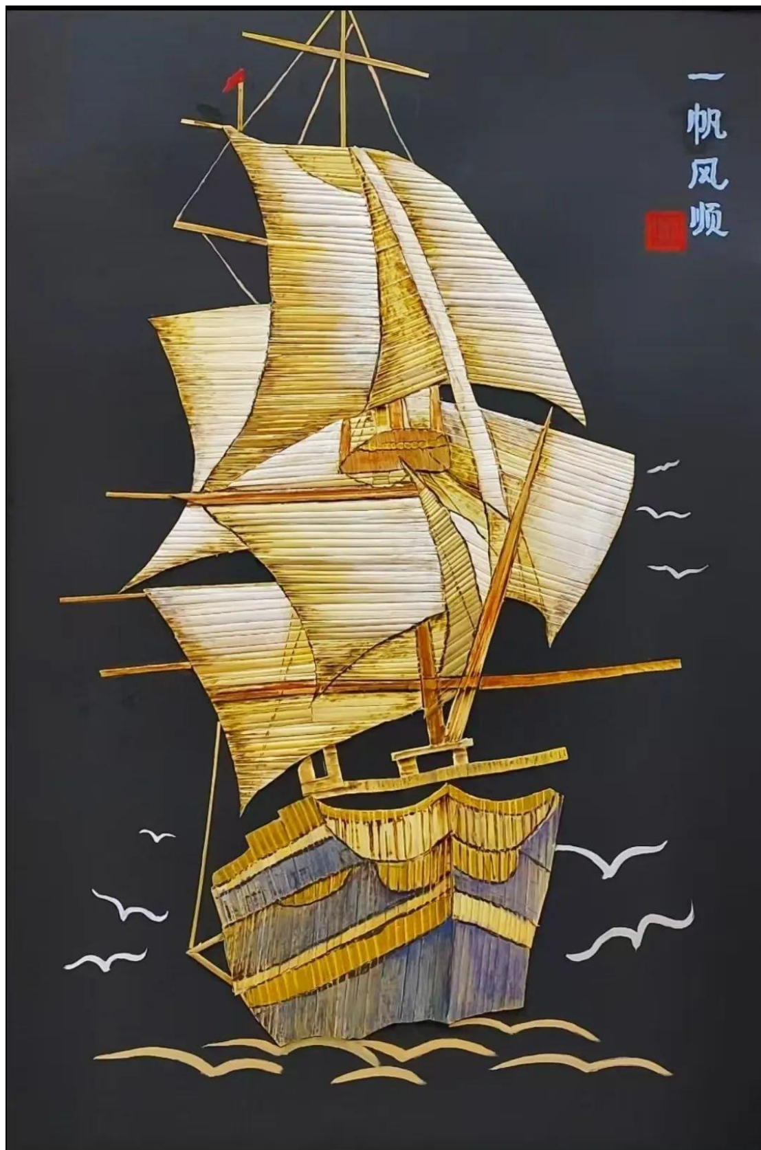
图 12 盘锦职业技术学院学生非遗芦苇画工作坊作品《一帆风顺》