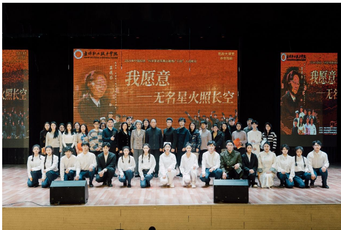
图 8 盘锦职业技术学院原创舞台剧《我愿意——无名星火照长空》入选 2025 年中国科协“科学家故事舞台剧推广行动”重点培育剧目

盘锦职业技术学院深耕打造“盘锦职院、青春驿站、演绎精彩、无悔无憾”的品牌形象。原创舞台剧《我愿意——无名星火照长空》入选 2025 年中国科协重点培育剧目。连续举办两届校园文化艺术节，涵盖文艺演出、艺术展览、非遗展示展演等艺术活动；承办三届盘锦市职业技术教育非物质文化遗产创作大赛，学生参赛作品荣获奖项 162 项。非遗芦苇画、非遗剪纸惊艳亮相全国职业教育成果展、东北三省一区 and 辽宁省职业教育成果展。新华社相关平台刊载了盘锦职业技术学院青年学子首创推出的《飞花令》系列微视频。《充分运用地域文化资源 探索思政课教学新路径》等相关办学成果被《中国教育报》《光明日报》和高职高专网、新华社等多家权威媒体报道。