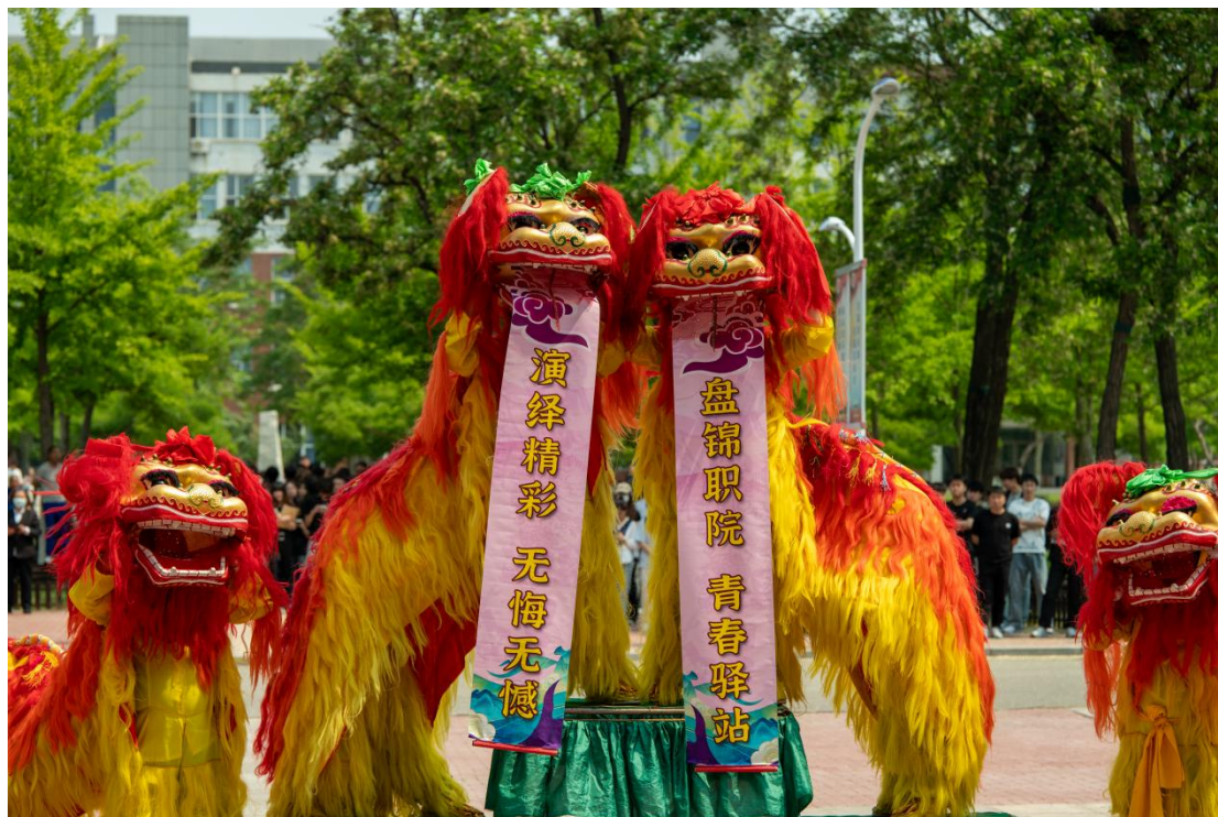
图9 盘锦非遗项目新开舞狮在盘锦职业技术学院 首届校园文化艺术节惊艳亮相