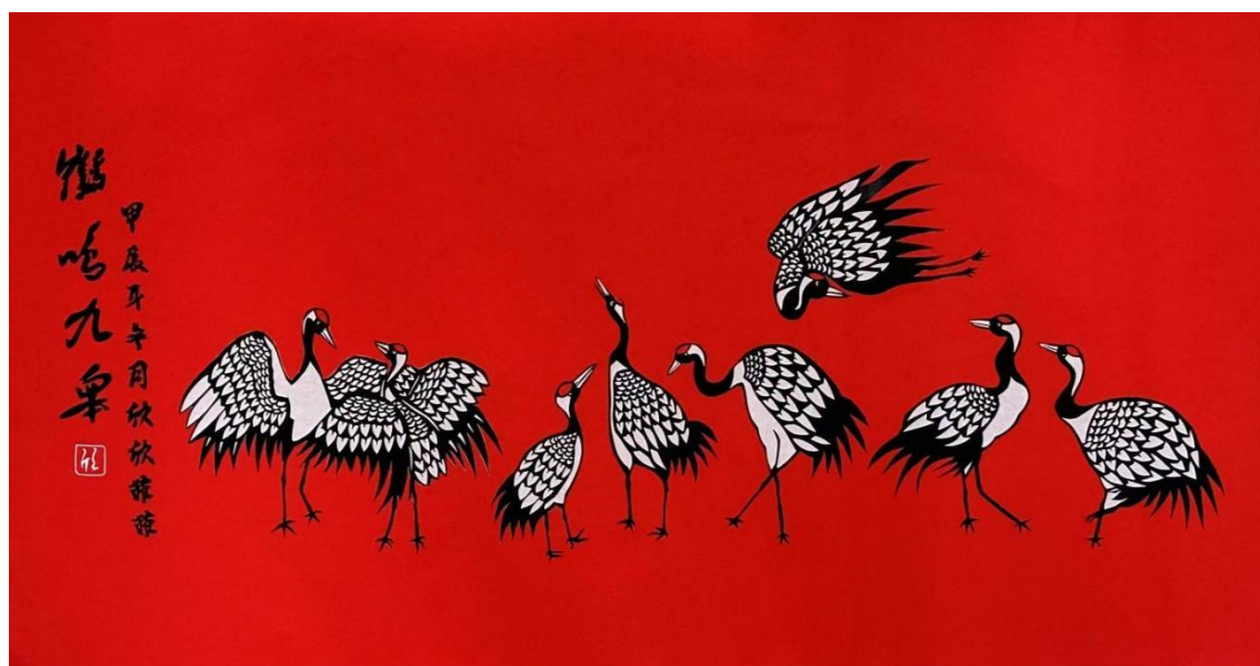
图10 盘锦职业技术学院剪纸画作品《鹤鸣九皋》荣获一等奖