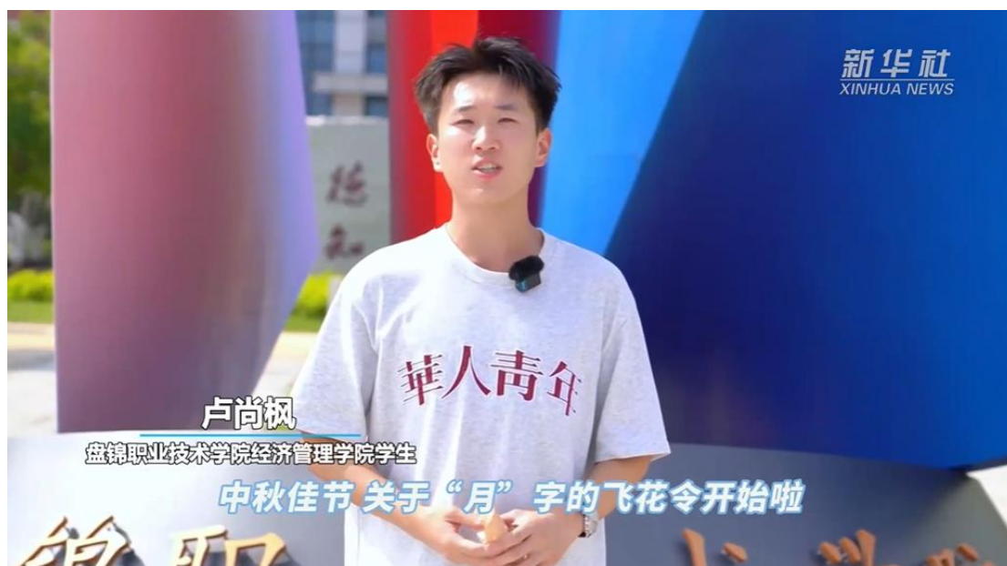
图 14 新华社客户端推送学校“中秋”飞花令

盘锦市职业学校通过系统构建“35335”文化传承体系，聚焦高素质技能人才培养，在传承中华优秀传统文化、地方特色文化、