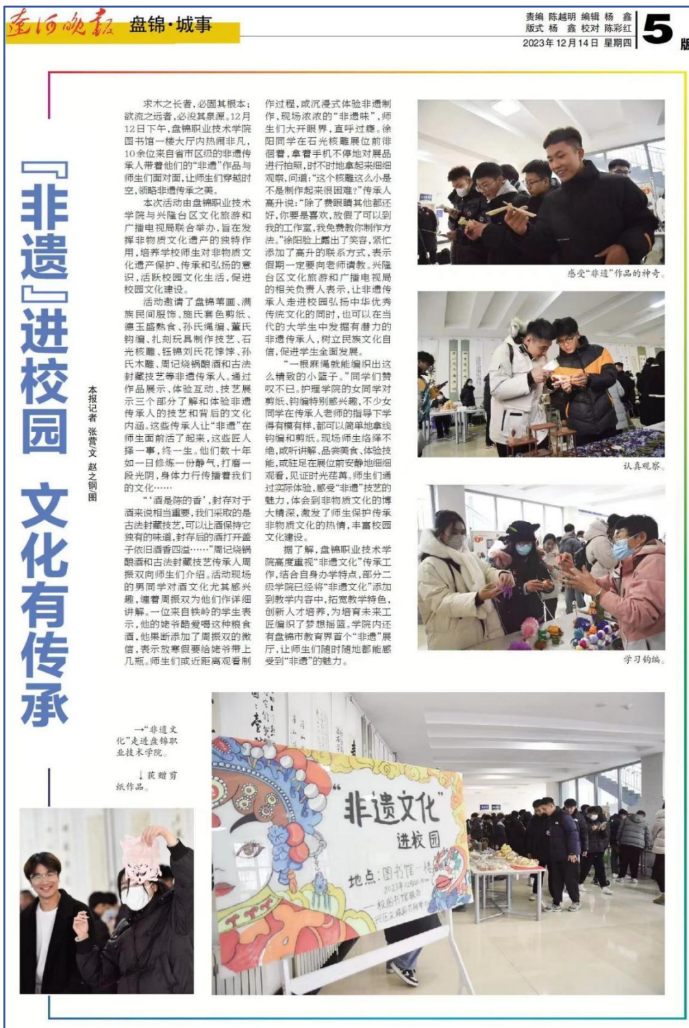
图7 《辽河晚报》报道盘锦职业技术学院“非遗进校园”活动

多年来接待企事业单位及海内外参观者2万多人次，为盘锦市的非遗文化传承、保护、宣传工作做出了积极贡献。《非遗进校园 文化有传承》在《辽河晚报》进行了报道。