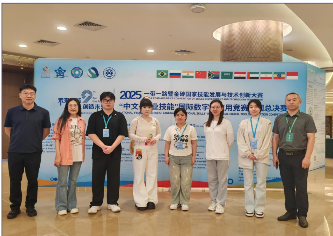
图6 盘锦职业技术学院幼儿保育专业学生参加“中文+职业技能”国际数字化应用竞赛荣获全国总决赛一等奖