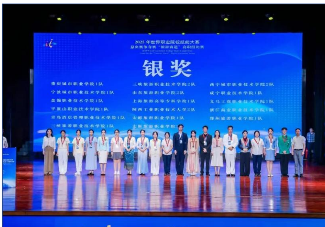
图 5 盘锦职业技术学院旅游管理专业学生在 2025 年世界职业院校技能大赛争夺赛中荣获银奖

近五年，盘锦职业技术学院累计培养高素质技能人才 15814 人，毕业生毕业去向落实率达 95% 以上。用人单位满意度达 98% 以上，人才培养质量得到社会广泛认可。学生在各类技能大赛和创新创业大赛中荣获奖项 510 项。其中，世界职业院校技能大赛和全国职业院校技能大赛奖项 17 项，大学生创新创业大赛国赛奖项 3 项。