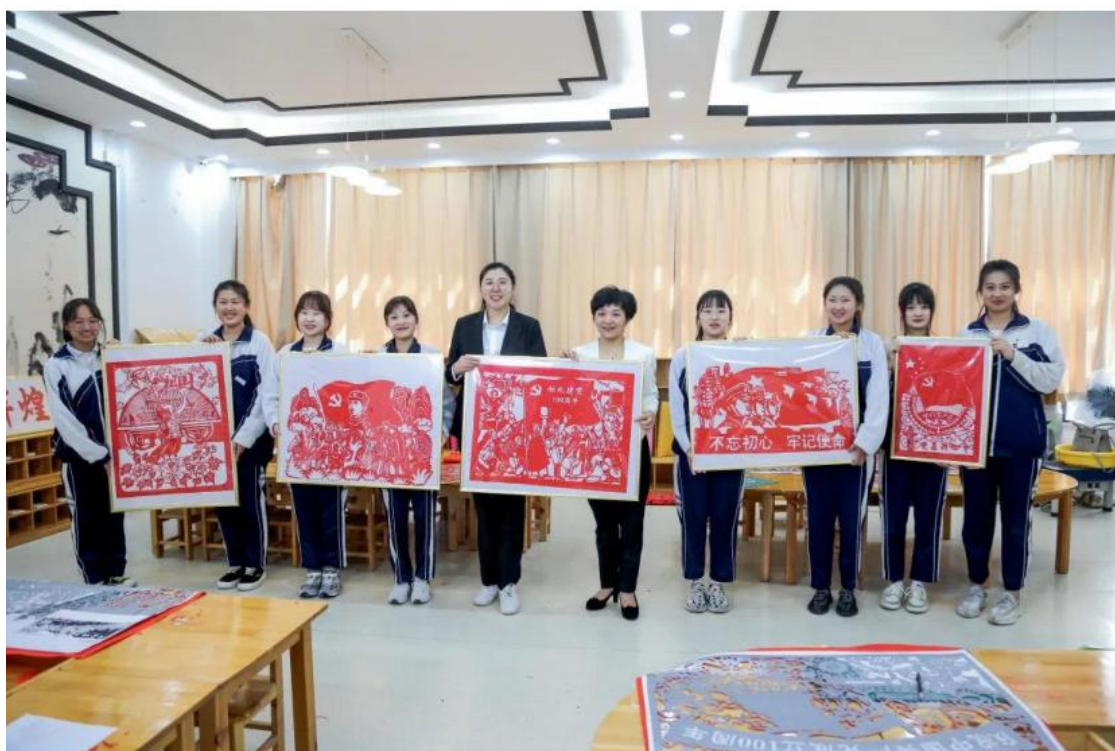
图 11 盘山县职业教育中心学生剪纸作品