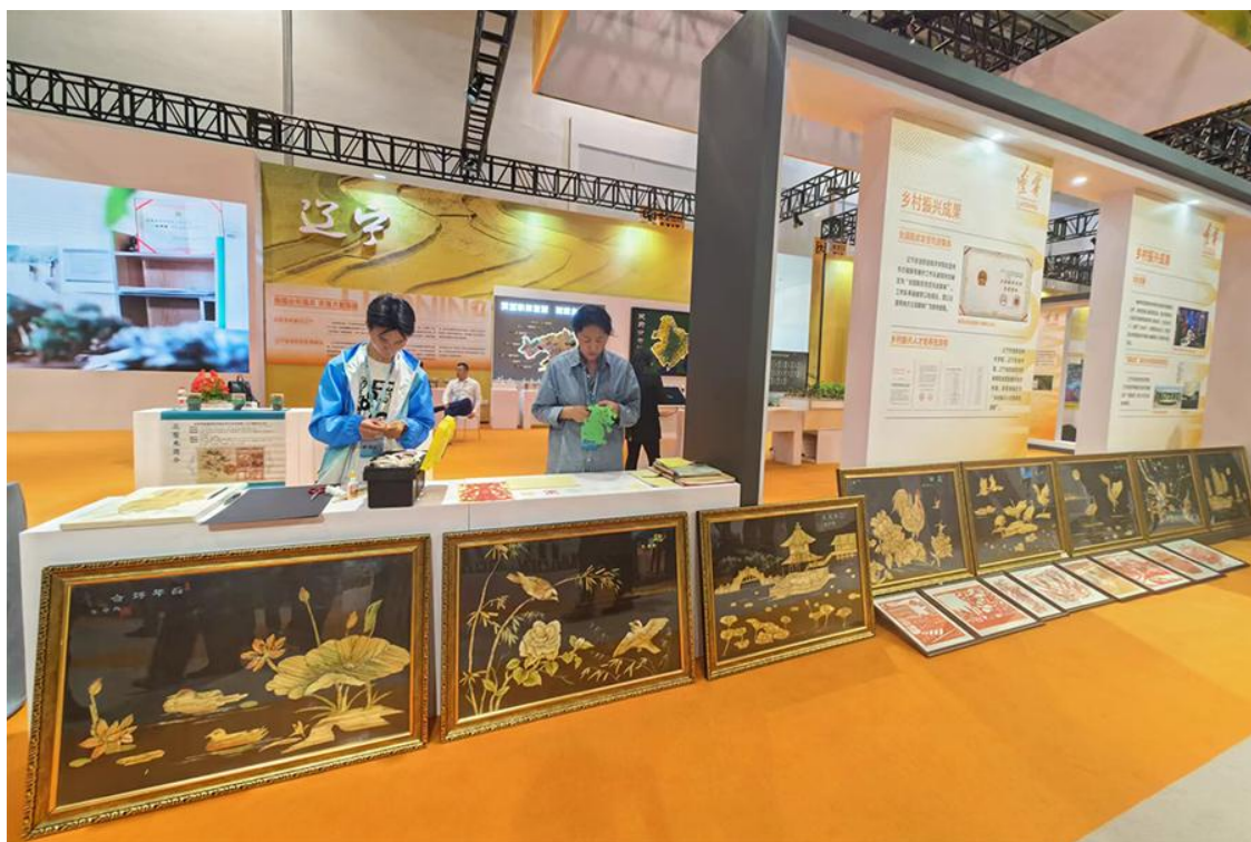
图 13 盘锦职业技术学院非遗芦苇画、非遗剪纸惊艳亮相全国职业教育成果展