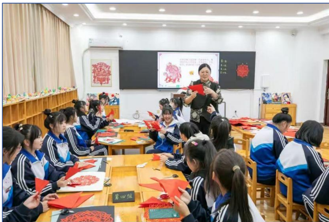
图3 盘山县职业教育中心在兴趣拓展班中培养学生工匠精神